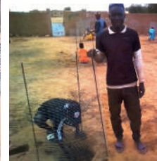
Plantation des arbres à l'école de Lidoubé.