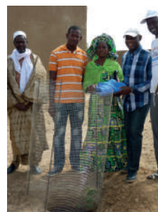
Les neems sont des arbres qui poussent rapidement. (photos : avril 2017 à Lidoubé).