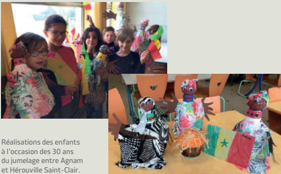
Réalisations des enfants à l'occasion des 30 ans du jumelage entre Agnam et Hérouville Saint-Clair.

Parallèlement au projet de plantation des arbres, les enfants de l'école de Lidoubé à Agnam et les enfants de l'école de Boisard à Hérouville ont démarré une correspondance et travaillent sur la thématique de la protection de l'environnement.