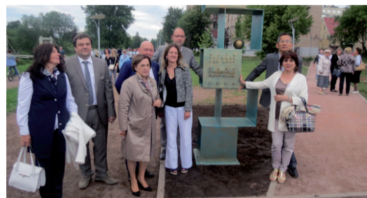
Célébration des 25 ans du jumelage à Tikhvine, juillet 2016.