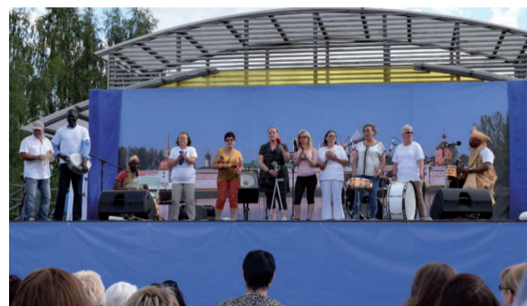
Spectacle de l'association hérouvillaise Couleur Calao à l'occasion des 25 ans à Tikhvine, juillet 2016.