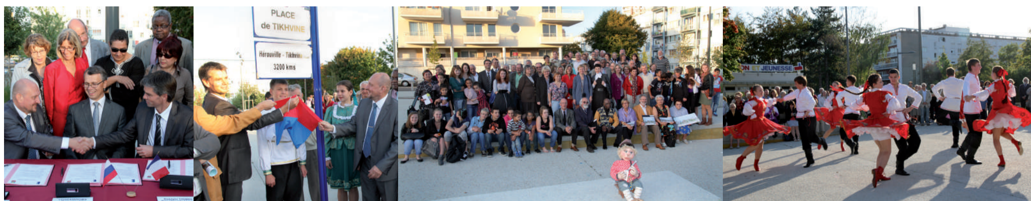
CÉLÉBRATIONS 20 ANS DU JUMELAGE À HÉROUVILLE, 2011 : Inauguration de la place Tikhvine, à Hérouville St-Clair